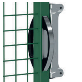
Par de manillas de aluminio para puertas abatibles dobles