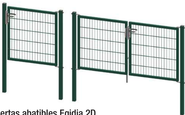
Puertas abatibles Egidia 2D