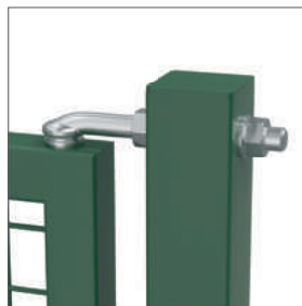
Bisagras M16 galvanizadas en caliente robustas y fáciles de ajustar