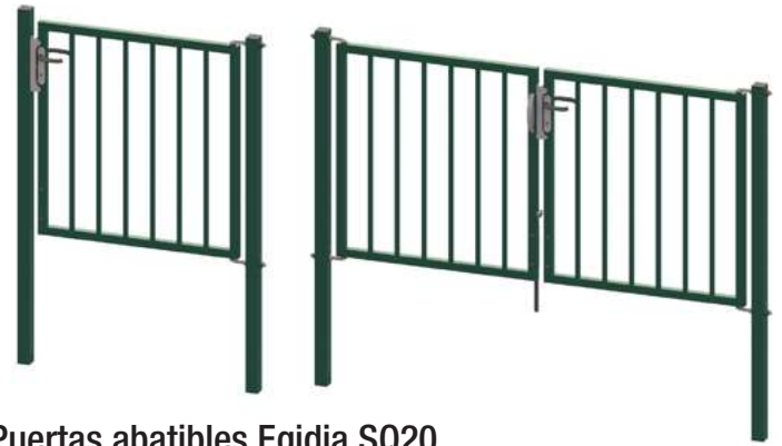
Puertas abatibles Egidia SQ20