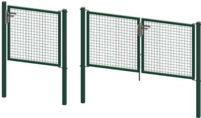
Puertas abatibles Egidia M50