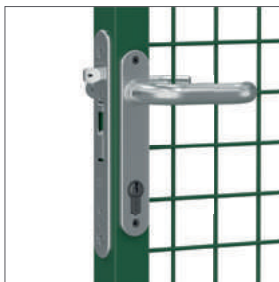
Cerradura integrada de acero inoxidable con contracierre y manillas de aluminio