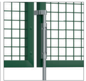
Perno de fijación al suelo y soporte para puertas abatibles dobles