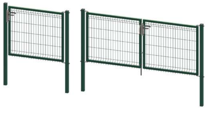
Puertas abatibles Egidia 3D